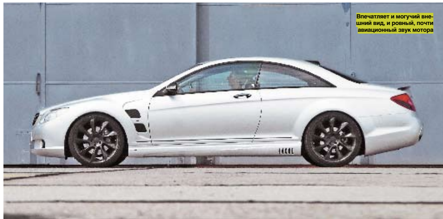
Впечатляет и могучий внешний вид, и ровный, почти авиационный звук мотора