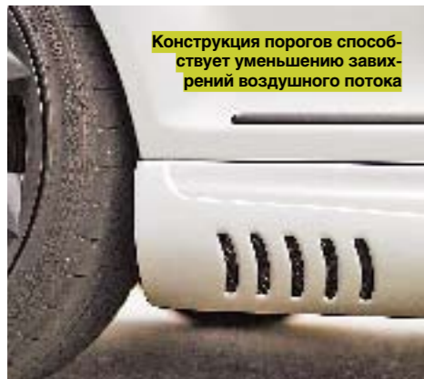
Конструкция порогов способствует уменьшению завихрений воздушного потока

У доработанного двигателя, максимальный крутящий момент которого доведен до 585 Нм, есть что предложить если не на гоночном треке, то на дороге, позволяющей использовать появившиеся возможности. Причем без тех излишеств, которые стали обычными для машин с объемными двигателями. Так, например, у CL 65 AMG датчики на приборной панели почти постоянно подают сигналы, свидетельствующие о том, как отчаянно электроника пытается обуздать невероятную силу, рвущуюся из-под задних колес. ➤